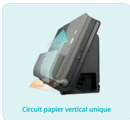
Circuit papier vertical unique

Le circuit d'alimentation papier vertical permet au scanner DR-C225/W d'afficher le plus faible encombrement de sa catégorie. De plus, la conception astucieuse du passage des câbles permet d'appuyer ces appareils directement contre un mur ou bien de les placer sur un plan de travail dont la surface est limitée.